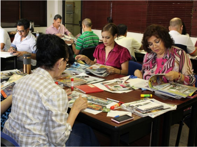
Figura 1. Un grupo de personas creando alternativas a través de carteles temáticos.

Diseñar es una habilidad del ser humano, y solo algunas personas deciden dedicarse profesionalmente a ello (Cross, 1999). Considerar a los usuarios como individuos activos que pueden contribuir a la creación de alternativas es viable. Incluir a las personas que viven el día a día un inconveniente social puede evitar que especialistas en diseño propongan soluciones inadecuadas que se basan en interpretaciones superficiales. La relación del especialista en diseño con los usuarios potenciales debe ser horizontal, bajo la premisa de que todas las personas tienen la capacidad de crear soluciones a sus retos o problemas y los diseñadores pueden estimular las condiciones para que esto se dé (Ver Manzini, 2015). El punto central que queremos comunicar es que idealmente las soluciones para afrontar retos sociales no se generan de manera aislada, recurriendo a los dones de especialistas, sino de forma colaborativa, a través del co-diseño (Manzini, 2015; Alatorre, 2015) o de la democratización de las soluciones (Björgvinsson, Ehn, y Hillgren, 2010). Esto representa un nuevo escenario para la práctica de nuestra disciplina porque tradicionalmente se trabaja de manera independiente o en grupos, en donde los responsables del proyecto suelen ser sólo diseñadores/as.