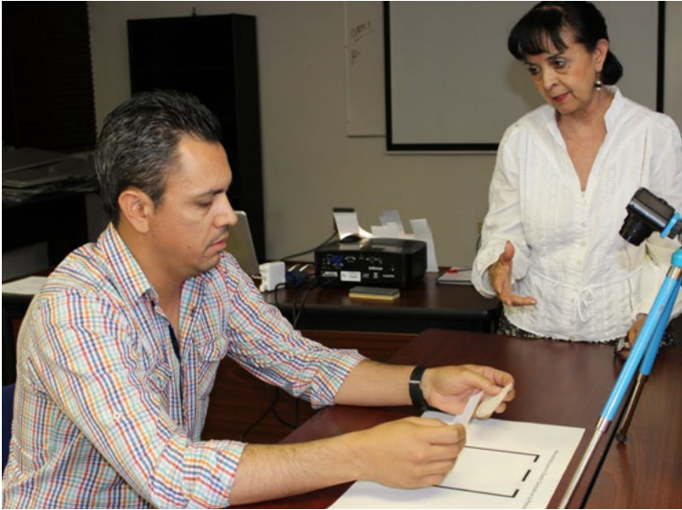
Figura 3. Diseñadora implementando un proyecto de investigación.

Implementar investigación para el diseño, ver Figura 3, radica en establecer claramente el objetivo y método de recolección de datos, características de la población participante, así como el método de análisis, de lo contrario los resultados serán poco relevantes, pues si la investigación está mal planeada e implementada puede confirmar las predisposiciones y prejuicios de especialistas en diseño, lo cual representa un problema más que un beneficio. Otro factor básico, reside en establecer cómo se analizarán, sintetizarán y reportarán los resultados, considerando que la información recabada servirá para el proceso creativo. Así, los diseñadores interesados en la innovación social tendrían que desarrollar habilidades básicas de investigación para el diseño, lo que implica planearla, analizarla e implementarla.